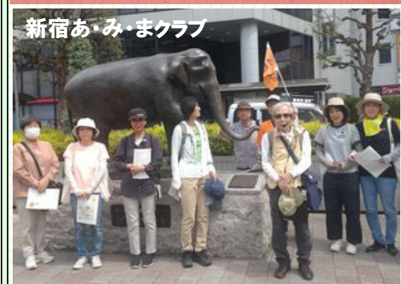
新宿あ・み・まクラブ