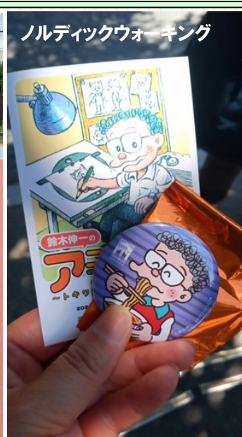
ノルディックウォーキング